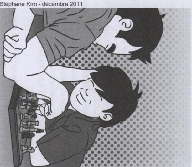
Stéphane Kirn - décembre 2011

Dans les faits : il essuie quotidiennement des reproches, à la maison, à l'école, à la garderie, chez les copains, dans les magasins lorsqu'il ne se conduit pas bien ! Partout, tout le temps !